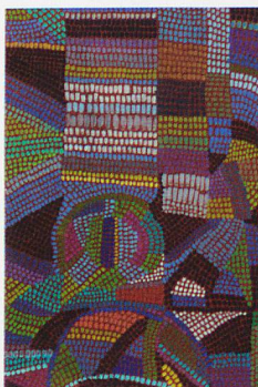
Sonja Sekula, Nr. II, «Durch-Sicht», 1957, Öl auf Leinwand, Kunstmuseum Luzern

Seematt Seestrasse 3 6205 Eich 041 462 98 00 info@seematt-eich.ch www.seematt-eich.ch