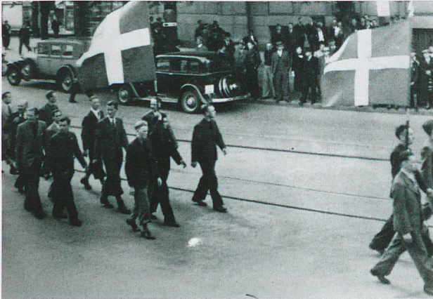
Fröntler paradierten an einem Sonntagnachmittag im Mai 1937 durch Luzern.

umzufunktionieren. Auf Ausgleich setzte ab 1935 die SP: Ihr neues Parteiprogramm bekannte sich nun zur Landesverteidigung und zur parlamentarischen Demokratie. Mit dem Friedensabkommen von 1937 zwischen dem Metall- und Uhrenarbeiterverband (SMUV) und der Arbeitgebervereinigung wurde auf Streiks verzichtet und die Grundlage für den Arbeitsfrieden gelegt. Es wurde zum Modell für spätere Gesamtarbeitsverträge.