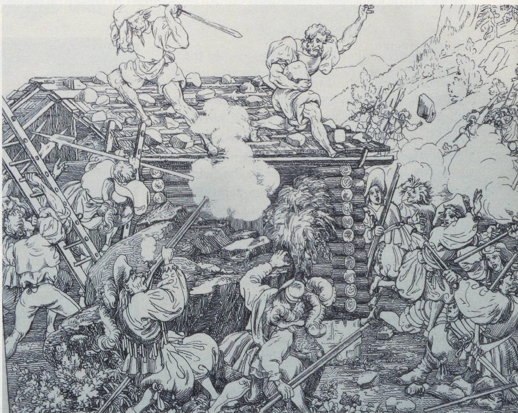
Martin Disteli, 1840: «Unternährer und Hinteruoli – die letzten freien Entlebucher». Stadelmann, der Dritte der «Drei Entlebucher Tellen», kann fliehen und wird nach langer Verfolgung 1654 in Luzern hingerichtet.

Am 18. Dezember werten die «gnädigen Herren von Luzern» die Berner Batzen um 50 Prozent ab, die in wenigen Tagen einen Drittel ihres Werts verlieren. Diese Frist nützen die Stadtbürger, um ihre Münzbestände an die Bauern abzustossen. Es werden auf dem Land gefällige Kredite gewährt, mit Münzen, die in wenigen Tagen ein Drittel ihres Werts verlieren.