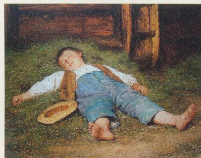
Unterstützt durch klin. Forschungsschwerpunkt "Schlaf & Gesundheit"

Für weitere Informationen kontaktieren Sie bitte das Schlaf & Gesundheit Team: SchlafGesundheit@pharma.uzh.ch