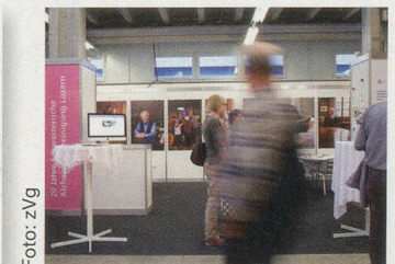
LUGA: Der Stand in einer der Messehallen auf der Allmend war ein grosser Erfolg.