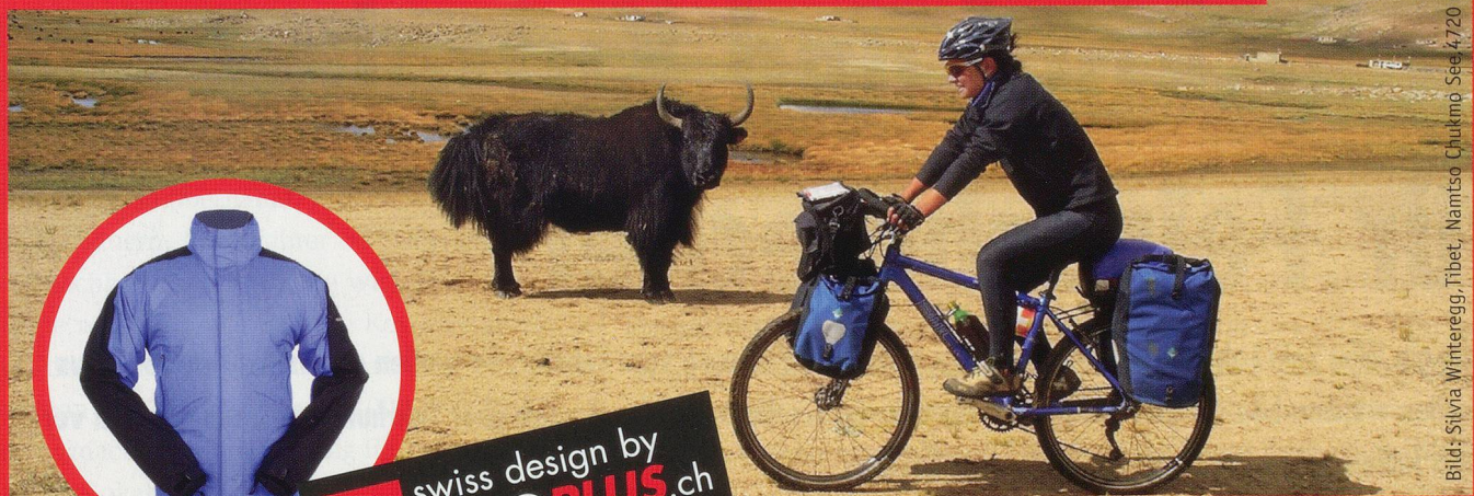
Tibet, Namtso Chukmp. See 4720 m ü.M.