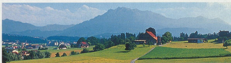
Astrid Bigler, 6032 Emmen