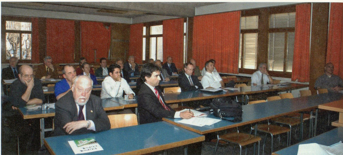
Une assemblée attentive, mais un peu perplexe.

ce thème au travers de ses actions de communication, à savoir principalement la publication du Bulletin et sa conférence d'automne lors du prochain exercice.