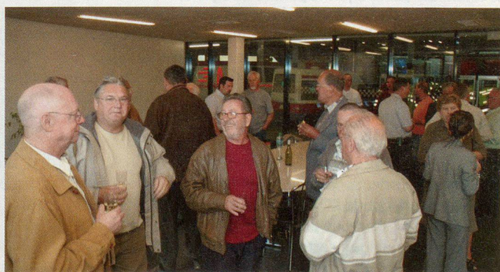
L'heure de l'apéritif offert par la Ville.

La protection civile sur Internet! www.protectioncivile.ch