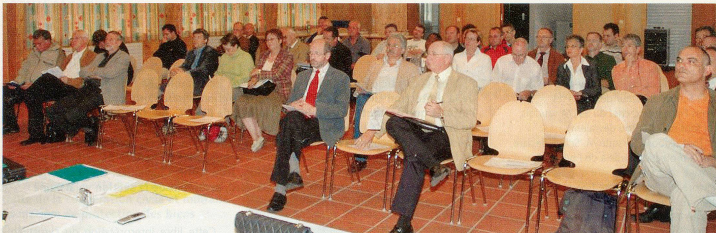
Plus de 40 participants pour prendre connaissance des nouveautés de la PCI.

membres, malgré les fusions de communes et la difficulté de recruter des membres dans la nouvelle protection civile rajeunie. La question des cotisations ne se pose pas, pour l'instant. Nous ne faisons que différer le problème dans le temps. Par contre, nous devons nous poser la question de nos missions et de notre pérennité dans le cadre de la nouvelle protection de la population.