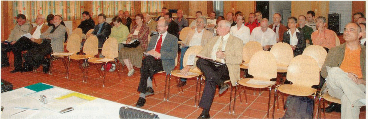
Plus de 40 participants pour prendre connaissance des nouveautés de la PCI.

membres, malgré les fusions de communes et la difficulté de recruter des membres dans la nouvelle protection civile rajeunie. La question des cotisations ne se pose pas, pour l'instant. Nous ne faisons que différer le problème dans le temps. Par contre, nous devons nous poser la question de nos missions et de notre pérennité dans le cadre de la nouvelle protection de la population.