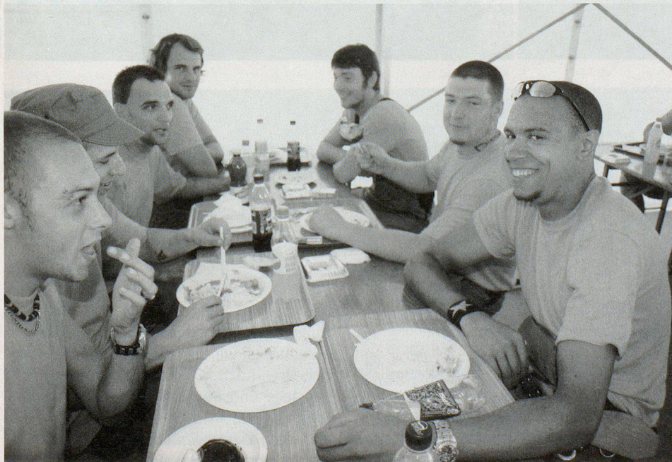
Nach der Arbeit die wohlverdiente Verpflegungspause.

aus dem Zivilschutz trugen. Grund: Die Infanteristen besitzen selbst nur die schweren Helme, die sich für den Aufbau der Tribünen nicht eignen würden. Ein besonderes Augenmerk galt der Bewachung, der Sanität und dem Einsatz der Hundeführer. Immer wieder wurden die «Aufbauer» mit zivilen Besuchern (Schaulustigen) auf den Tribünen konfrontiert. «Eigentlich ist das Gelände abgesperrt, und private Besichtigungen sind aus sicherheitstechnischen Gründen nicht gestattet», berichtete Robert Brendlin. Wenn man die Leute auf das Risiko angesprochen habe, habe man meist zur Antwort erhalten: «Wir wissen, dass es nicht erlaubt wäre, aber wir wollen nur schnell schauen, wo wir dann am Schwingfest sitzen.» □