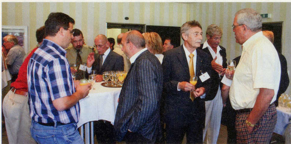
Fachgespräche nach der Stimmabgabe.

den Zivilschutz und die Zivilschützer in den Gemeinden einerseits und die Rechtssetzung und Unterstützung des Bundes «von oben» konzentrierend. Der SZSFVS vertrat damals, wie sein Name es sagte, mehr die Interessen der grossen Organisationen in Städten, für die sich andere Probleme abzeichneten. Seine Entwicklung bzw. Öffnung zu Gemeinden und Regionen mit mehr als 5000 Mitgliedern zeigt gleichsam den Weg, den der Zivilschutz im Rahmen des Bevölkerungsschutzes begangen hat.