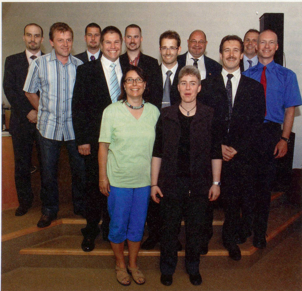
La nouvelle volée d'instructeurs et d'instructrices de la protection civile.