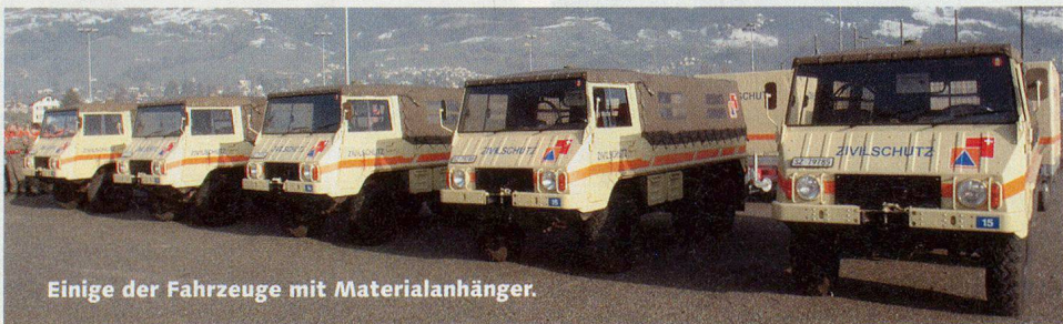
Einige der Fahrzeuge mit Materialanhänger.