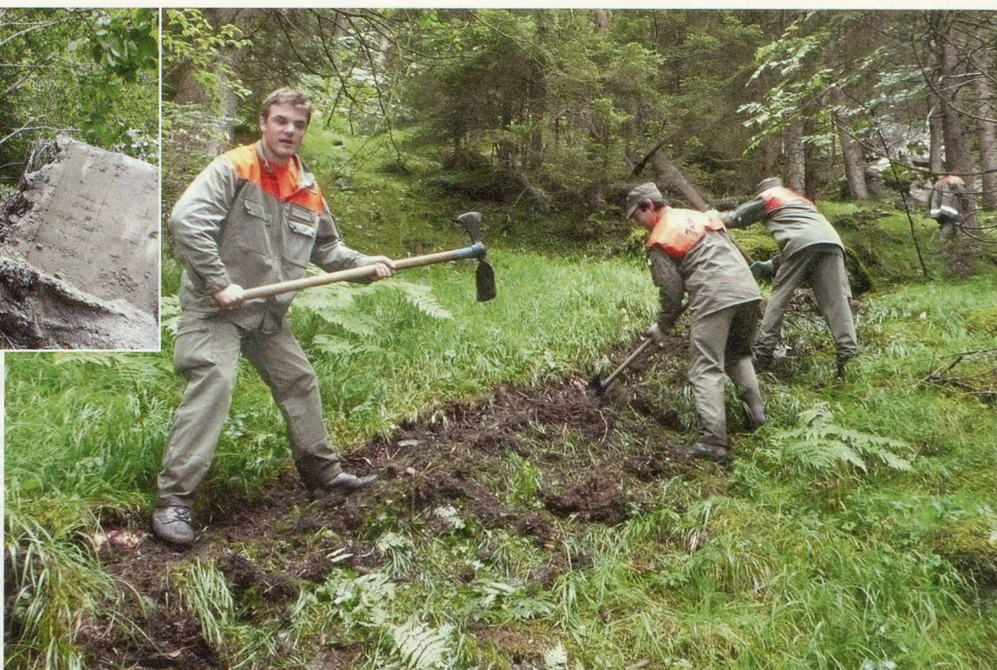
In teils unwegsamem Gelände zwischen Bristen und Silenen wird ein Weg angelegt.