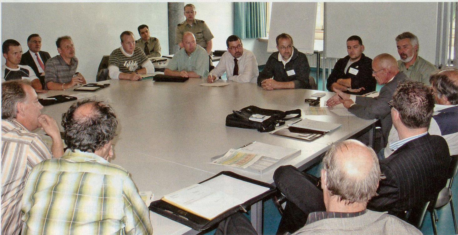
In mehreren Arbeitsgruppen kommen verschiedene «brennende» Themen zur Sprache.

die auch für Laien verständlich waren. Es wurde deutlich: Wir besiedeln immer mehr gefährdete Gebiete oder lösen durch die Besiedlung Gefahren aus. Katastrophen unterschiedlichster Art bis hin zu solchen terroristischen Ursprungs können mit einiger Sicherheit vorausgesagt werden. Gegen vieles kann man sich versichern, was oft eine Frage des Preises ist. Auch den Bevölkerungs-, insbesondere den Zivilschutz kann man als «Versicherung» ansehen. Stellt man sich jedoch fatalistisch oder in der Hoffnung auf Solidarität («die anderen werden im Notfall schon helfen») auf den Standpunkt «das alle 500 Jahre zu erwartende Erdbeben wird schon