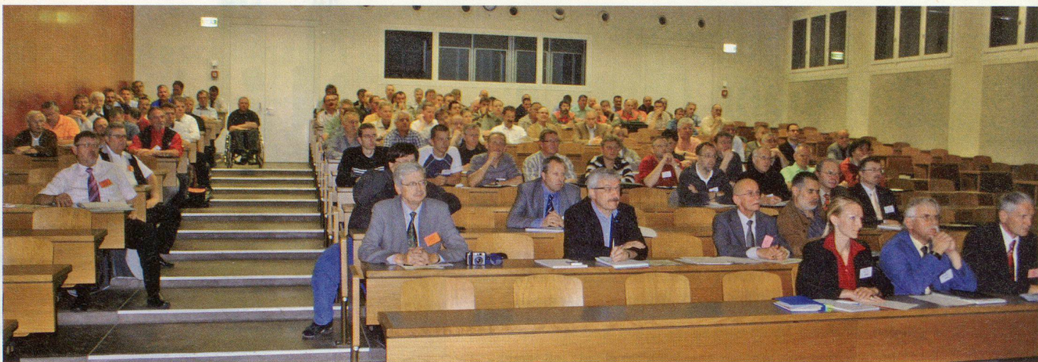
Etwa 140 Kaderleute des Zivilschutzes hören im AAL in Luzern aufmerksam zu und tauschen anschliessend Praxiserfahrungen aus.