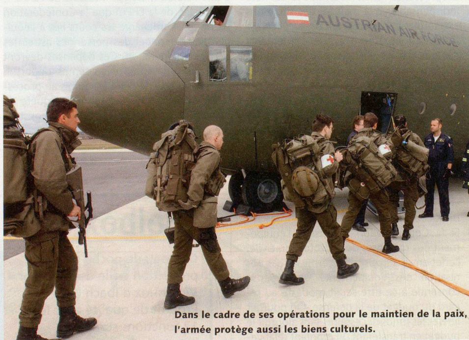
Dans le cadre de ses opérations pour le maintien de la paix, l'armée protège aussi les biens culturels.