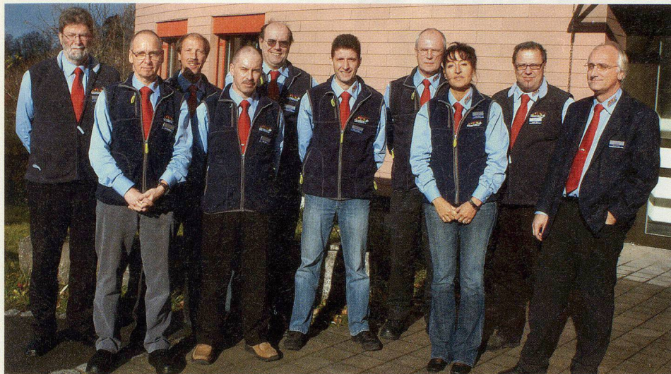
Das POLYCOM-Team vor dem Ausbildungsgebäude in Schwarzenburg.

BABS. Der Erfolg des Projekts Sicherheitsnetz Funk der Schweiz POLYCOM hat Auswirkungen im Ausbildungsbereich: Das Bundesamt für Bevölkerungsschutz BABS konnte im Eidg. Ausbildungszentrum in Schwarzenburg am 4. Dezember 2006 bereits den 100. POLYCOM-Kurs im Jahr 2006 durchführen. Im Frühjahr 2007 wird die Infrastruktur ausgebaut.