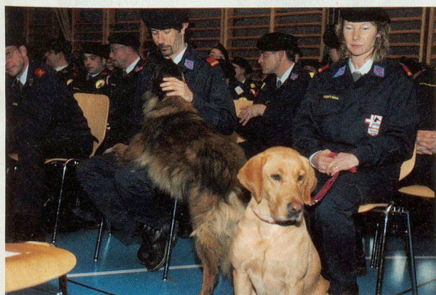
Une partie des chiens de la Redog.