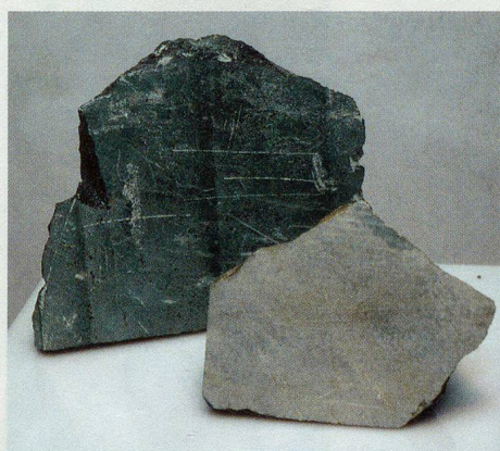
La pierre verte provient de la Vallée d'Aoste, l'autre de Bagnes.