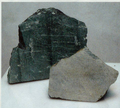
La pierre verte provient de la Vallée d'Aoste, l'autre de Bagnes.