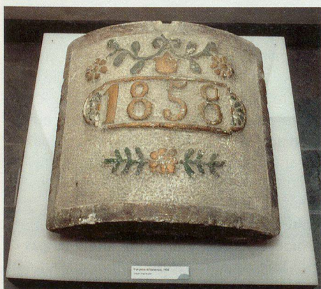
Une pierre taillée qui figurait sur un poêle.