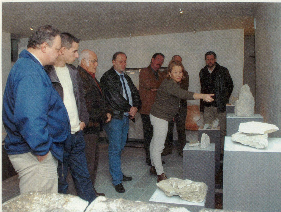
Visite guidée dans une des salles du Musée de la pierre ollaire.