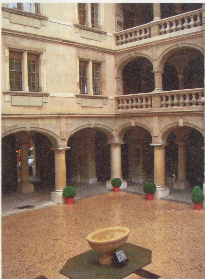
La cour de l'Hôtel de ville de Genève.