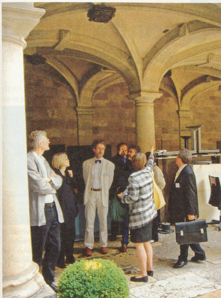
Membres du Comité suisse de protection des biens culturels.