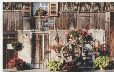
Ruggell: ancienne ferme.