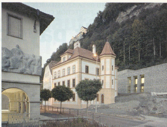
Le musée national à Vaduz.