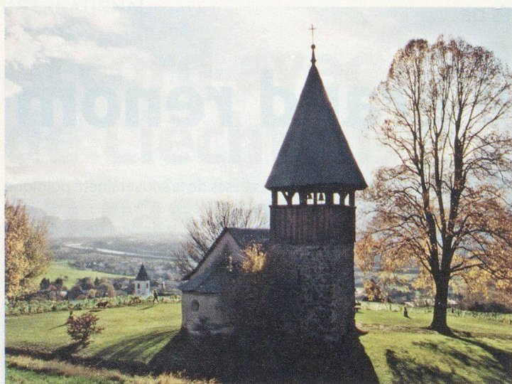
La chapelle de Mamerten à Triesen.