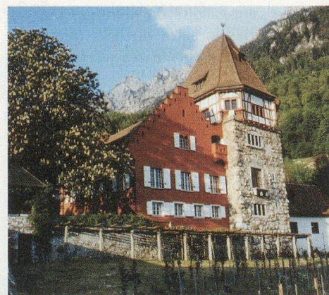
Vaduz: Rotes Haus.