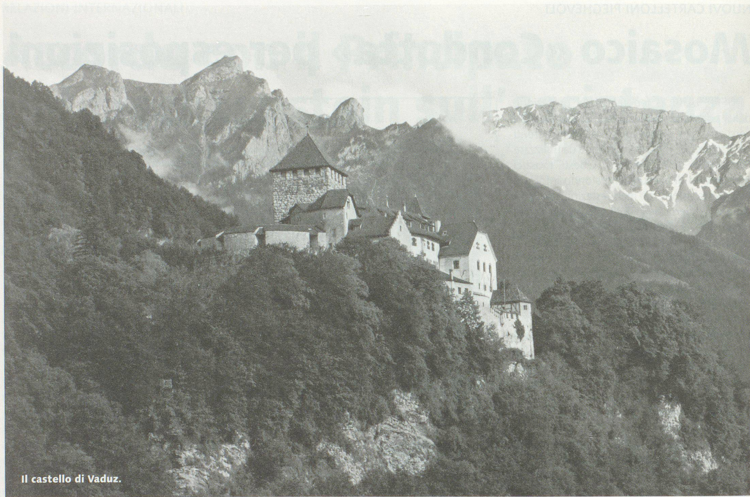
Il castello di Vaduz.

LIECHTENSTEIN – LUOGO DI SVOLGIMENTO DELL'ASSEMBLEA DEI DELEGATI 2006 DELL'UNIONE SVIZZERA PER LA PROTEZIONE CIVILE (USPC)