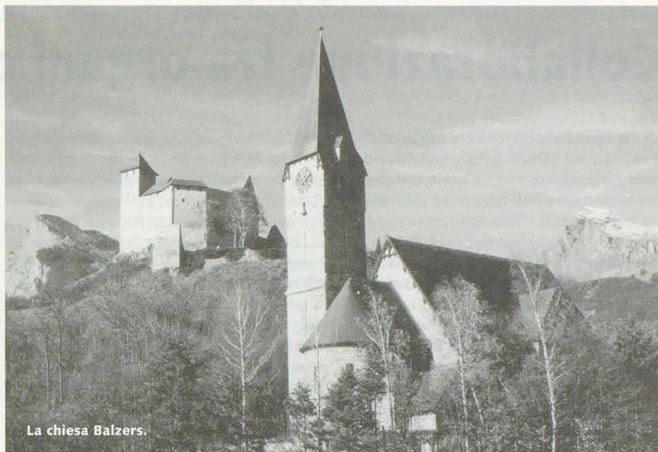
La chiesa Balzers.

La montagna più alta del «Ländle» è il Grauspitz con i suoi 2599 s.m. Si è fatto qualcosa per la salute e il benessere e c'è una buona gastronomia che ha ripreso vari elementi dalle cucine degli stati limitrofi. Se volessimo affrontare più in dettaglio le diverse manifestazioni culturali, i musei, la musica, il teatro e le arti figurative, andremmo troppo in là. Non ci rimane che raccomandare una visita a questo piccolo paese. E per cominciare subito suggeriamo di partecipare per esempio all'assemblea dei delegati dell'Unione svizzera per la protezione civile. □