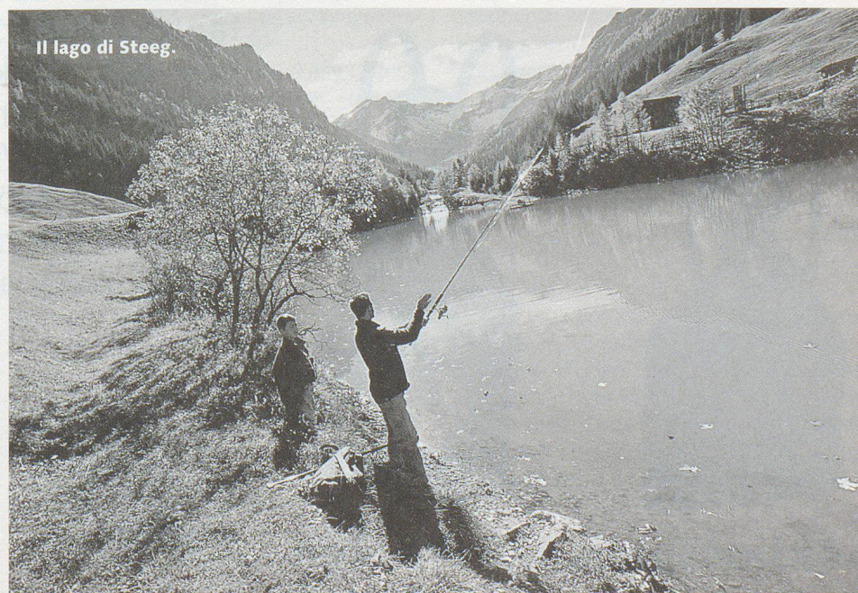
Il lago di Steeg.