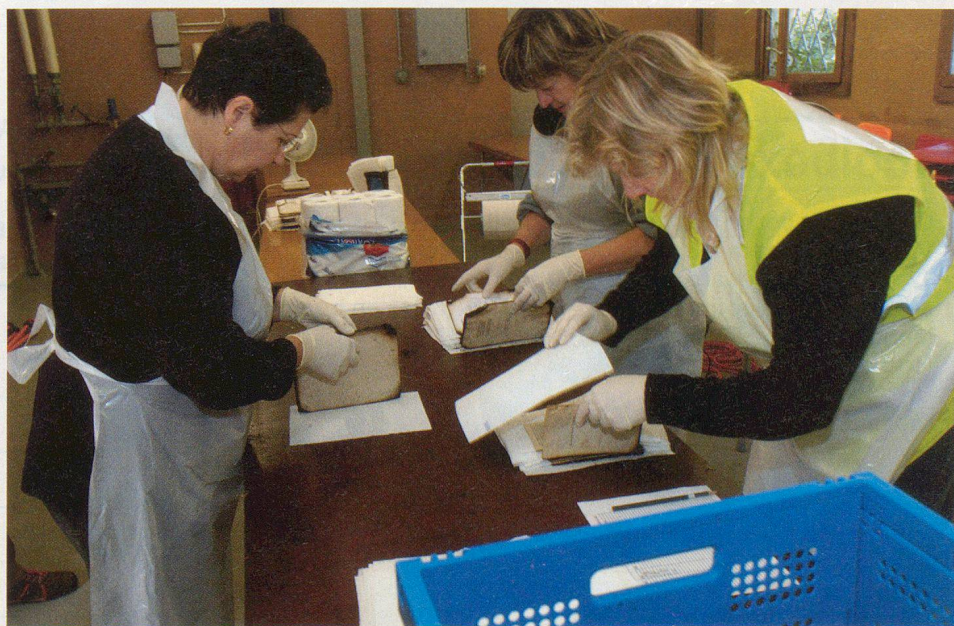
Un papier buvard est glissé entre les pages des ouvrages mouillés, et des ventilateurs aèrent la pièce.