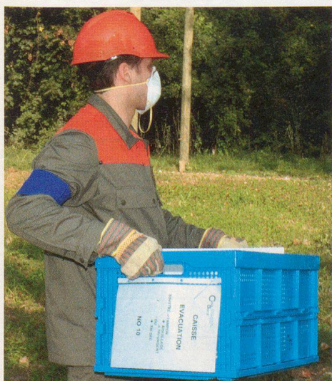
Les caisses étiquetées sont portées au centre de tri.

Lors de l'exercice feu de Gollion, chacun a pu constater que l'incendie ne détruit pas tout. Par contre, l'extinction cause également des dégâts dus à l'eau. Ainsi, il est impératif de se livrer à un tri rapide et de prendre des mesures «simples» et immédiates pour lutter contre les moisissures causées par l'eau d'extinction. Ces mesures, minutieuses pour la plupart, permettront ensuite une «congélation» des documents récupérables. Comme on l'a constaté pour une surface somme toute restreinte comme ce fut le cas à Gollion, le travail est considérable et ne souffre pas l'approximation. □