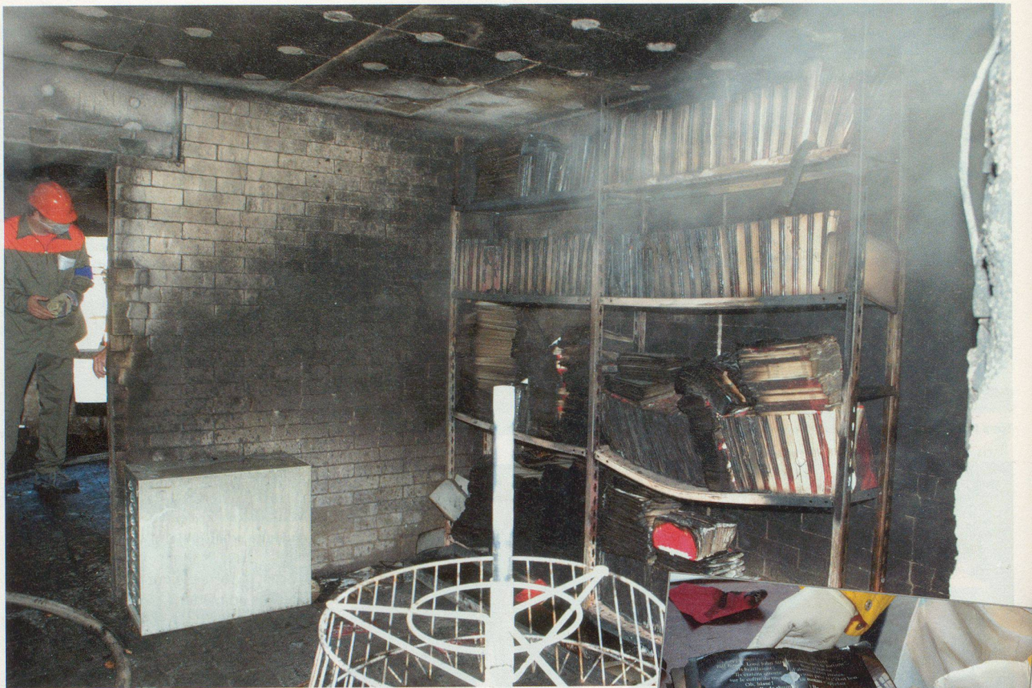
Premier constat après l'extinction de l'incendie.