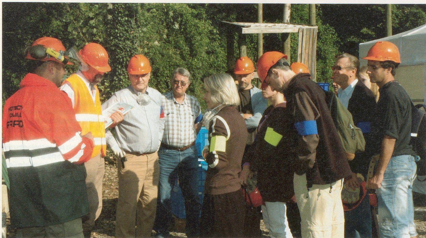
Briefing sur les mesures de sécurité (la couleur des brassards indique qui fait quoi).