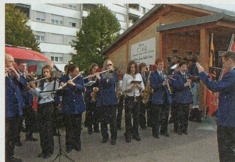
La musique municipale.

s'associer, à se renseigner, voire à tester les différentes animations créées par le Groupement de sécurité.