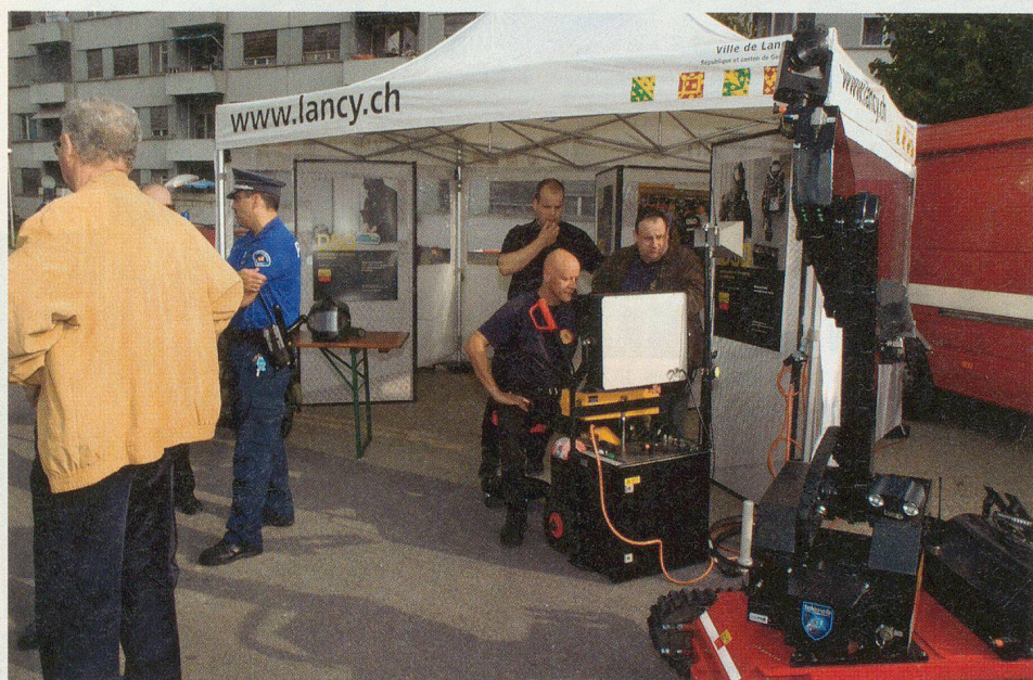
Démonstration d'un robot du Service de déminage du canton.