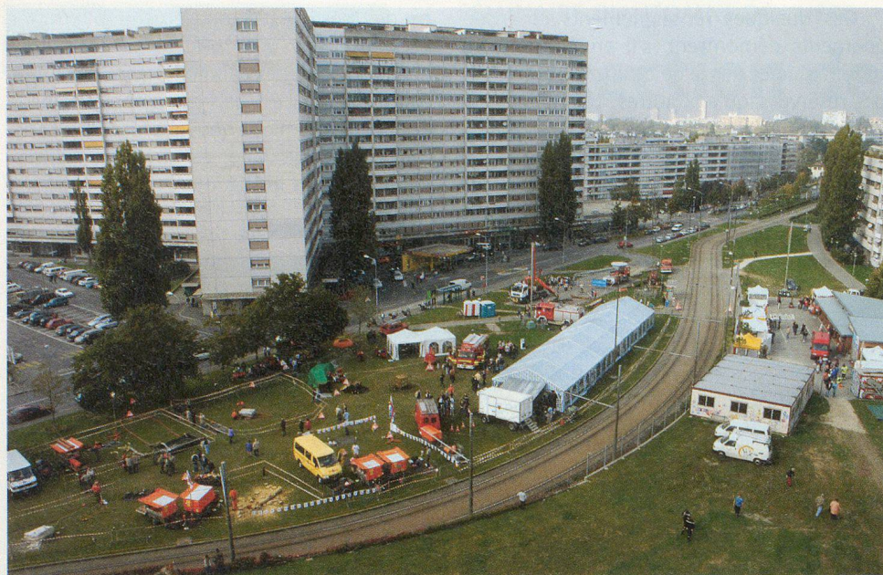
Une vue de la place de l'Esplanade (depuis la montgolfière).