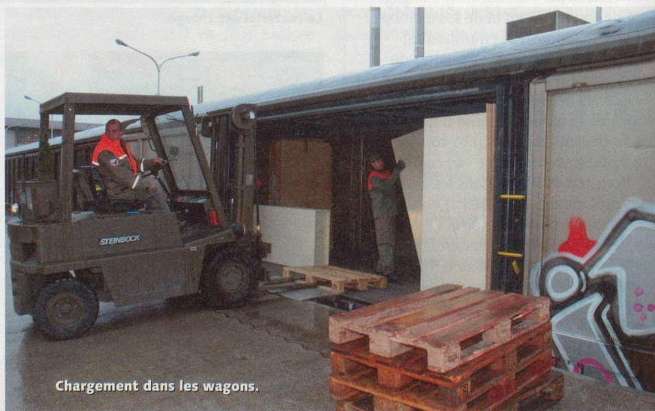
Chargement dans les wagons.