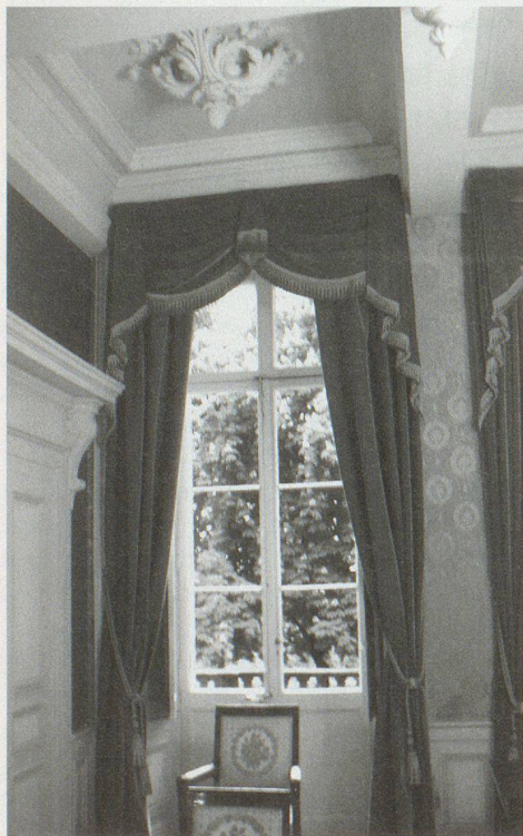
I locali del municipio di Ginevra testimoniano l'indiscutibile valore di questo bene culturale.