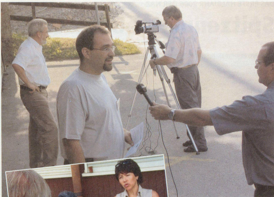
Oben: TV-Statements am frühen Morgen zur Einstimmung auf den Medienkurs.

Zusätzlich zu den Ausbildungskursen werden Übungen für Gemeindeführungsorgane bzw. Führungsstäbe angeboten. Diese Übungen werden nach wie vor in jedem Kanton separat organisiert und durchgeführt. Denn bei aller Zusammenarbeit: Ein wichtiger Faktor bei der Krisenbewältigung sind nach wie vor die spezifischen Verhältnisse vor Ort, in den betroffenen Regionen. □