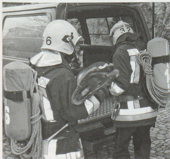
I pompieri di Sion in azione.