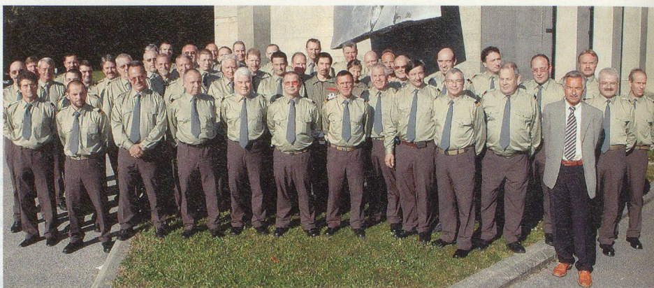
Les C ORPC et suppléants des 21 régions vaudoises.

Quant au président de l'assemblée des Comités directeurs, René Devantay, sans s'opposer à la nécessité de s'adapter, de se renouveler, moderniser, restreindre et dégraisser, il se montre plus réservé et moins enthousiaste que Denis Froidevaux. En substance, René Devantay se pose encore quelques questions quant à l'avenir. Que signifiera, dans les faits, le futur redécoupage des régions (note de la réd.: les futurs débats du Grand Conseil devraient se concentrer sur un découpage du canton en dix ou douze districts)? Et encore de relever que force est de constater, malgré les innombrables interventions de la PCi, que celle-ci est encore regardée avec beaucoup de «doutes» par les partenaires, voire par les autorités communales et au-delà par le citoyen.