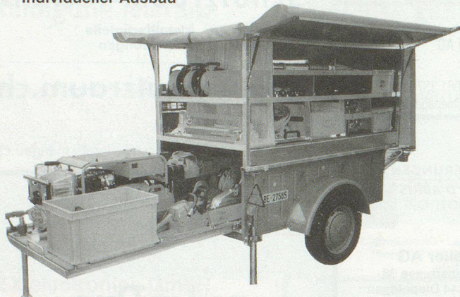
Superstructure pour remorque PC • Exécution individuelle