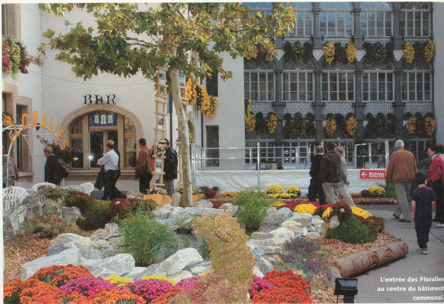
L'entrée des Florales au centre du bâtiment communal.