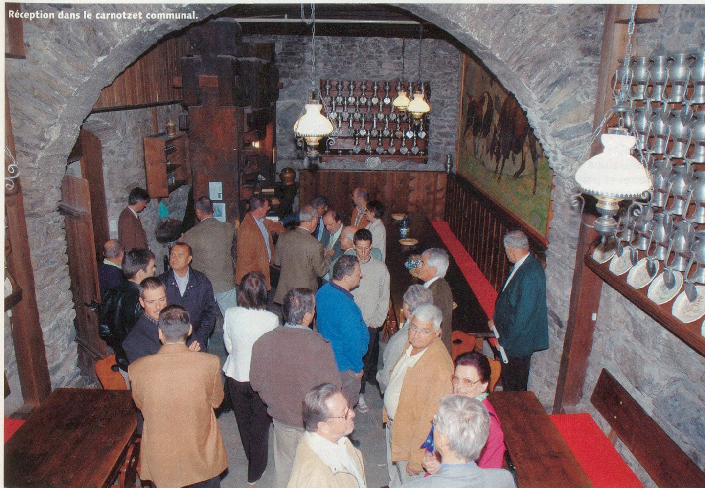
Réception dans le carnotzet communal.