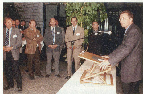
Quelque 180 responsables de la Confédération, des cantons et des villes ont participé à ce congrès.