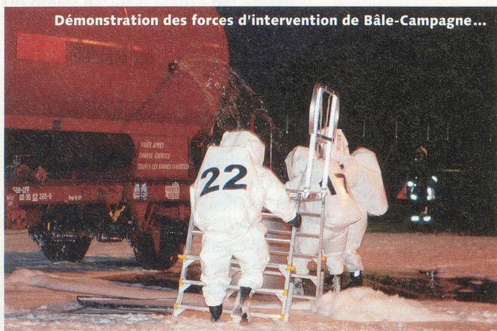
Démonstration des forces d'intervention de Bâle-Campagne...