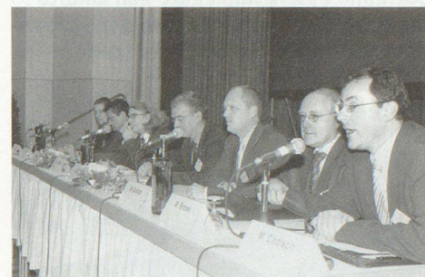
Qualche 180 responsabili hanno partecipato al congresso.

condotta, capi degli organi cantonali di coordinamento in caso di catastrofi o altre situazioni d'emergenza nonché rappresentanti dei mezzi di primo intervento (polizia, pompieri, sanità pubblica) e della protezione civile. Alla Conferenza sono inoltre invitati i segretari delle quattro conferenze governative responsabili della protezione della popolazione (polizia: CCDGP; pompieri: CGCSP; sanità pubblica: CDS; protezione civile: CDMPC). □