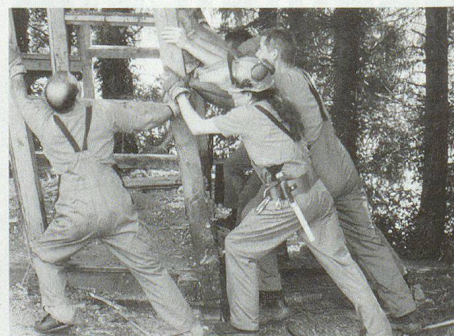
Beim Rückbau der Kläranlage.

Letzte Station. Es riecht nach Natur. Frisches Holz. Mühlweiher bei Abtwil. Ein Obstbaum wird umgelegt. Weiter unten glitzerndes Wasser. Sechs Mann stehen im Einsatz. Bereits vor zwei Jahren wurde der Weiher vom Zivilschutz eingezäunt. Jetzt wird der nahe Flusslauf gerodet.