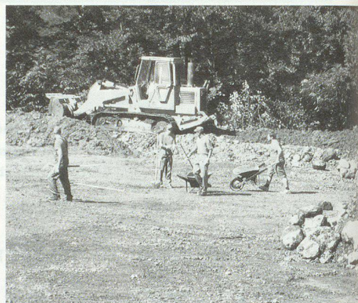
Arbeit von Hand und mit Maschinen.

UB. Vom 12.–16. September weilten Pioniere der ZSO Maiengrün in Engelberg, um der Bevölkerung des im August stark vom Unwetter betroffenen Orts beim Aufräumen zu helfen.