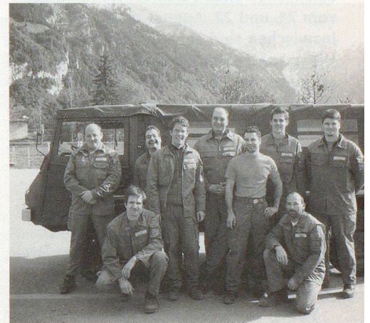
Die Wynentaler Zivilschützer mit ihrem Pinzgauer.

In diesen fünf Tagen führte die ZSO Wynental körperlich höchst anspruchsvolle Arbeiten aus. Nach dem ersten halben Tag mit Räumen von Wanderwegen beschäftigt, nahmen die Teilnehmer sodann an zwei verschiedenen Plätzen im Engelberger Wald Hangsicherungen in Angriff. Zusätzlich wurden an einem anderen Ort Stützmauern und Brückenfundamente gebaut. Mit schweren Geräten wie Bagger und Motorkarretten,