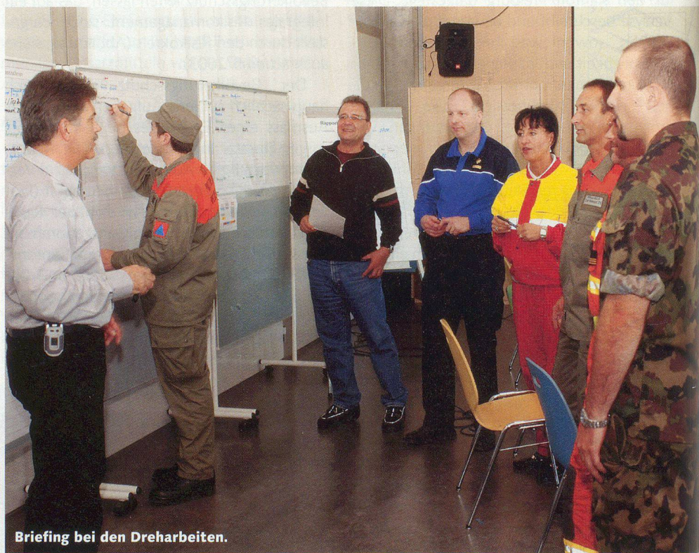
Briefing bei den Dreharbeiten.

Der Lehrfilm wird die Führungstätigkeiten und den chronologischen Ablauf der Stabsarbeit in einem regionalen Führungsorgan bei der Bewältigung eines flächendeckenden Ereignisses aufzeigen. Regisseur René Hagi realisiert den Film in Zusammenarbeit mit dem Zentrum Elektronische Medien (ZEM). Das Werk soll ab kommenden März zur Verfügung stehen. □