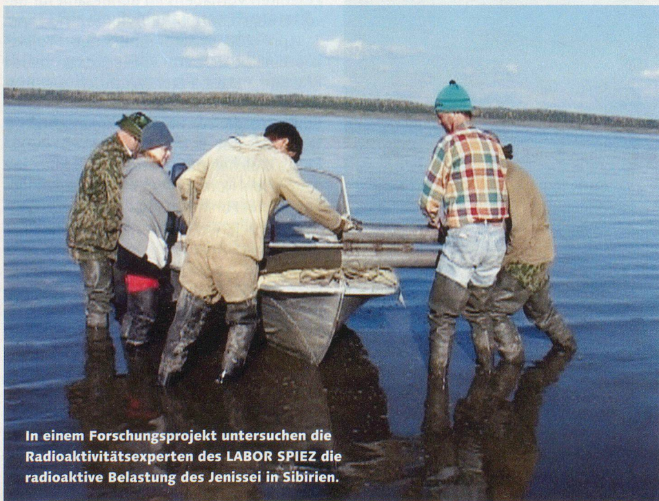
In einem Forschungsprojekt untersuchen die Radioaktivitätsexperten des LABOR SPIEZ die radioaktive Belastung des Jenissei in Sibirien.

zur Bewältigung eines vergleichbaren Krisenfalls leisten kann. Im Zentrum steht die ständige Bereitschaft für rasche Radioaktivitätsmessungen im Feld sowie die Fähigkeit zu vertieften Analysen im Labor. Dabei wird auch die enge Zusammenarbeit mit dem ABC Abwehr Labor 1 der Schweizer Armee dargestellt. In einem zweiten Teil werden verschiedene Alltagsanwendungen gezeigt: die routinemässige Radioaktivitätsüberwachung in der Schweiz, Aufgaben zur Verbesserung der Umweltsicherheit im Dienst von internationalen Organisationen sowie die Mitarbeit bei Forschungsprojekten.