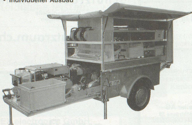
Superstructure pour remorque PC • Exécution individuelle