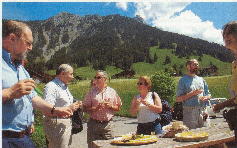
Un cadre idyllique pour un apéritif.

Enfin, la marque «Pays-d'Enhaut, produits authentiques» est une marque déposée par l'Association pour le développement du Pays-d'Enhaut (ADPE). L'ADPE réunit les communes de Château-d'Œx, Rougemont et Rossinière. Il faut aussi savoir que la marque «Pays-d'Enhaut, produits authentiques» rassemble sous ce label une trentaine de produits de cette région (fromages frais, à pâtes dure, mi-dure, molle, fondues, lait, yoghourts, miel, porc d'alpage, charcuterie, viande bovine) qui font honneur à leurs ambassadeurs, le fromage d'alpage L'Etivaz AOC et la tomme Fleurette de Rougemont. Leur provenance est strictement contrôlée, les matières premières étant issues du terroir et travaillées exclusivement dans la région. □