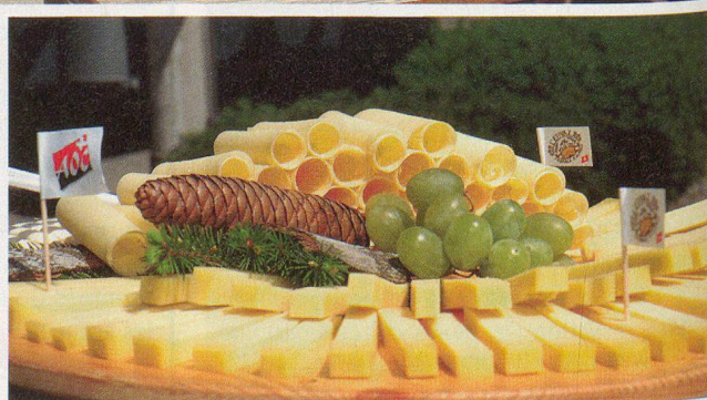
Un beau plateau avec fromage et rebibes.