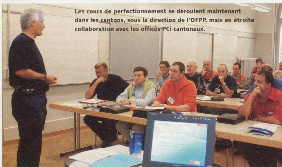
Les cours de perfectionnement se déroulent maintenant dans les cantons, sous la direction de l'OFPP, mais en étroite collaboration avec les offices PCI cantonaux.

Pour les thèmes généraux, des cours modulaires destinés aux commandants de la protection civile et à leurs suppléants seront développés ces prochaines années. Ils se