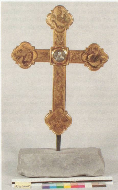
Inventaire du crucifix.