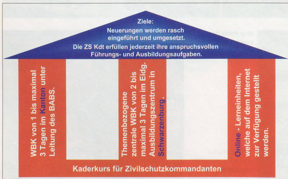
Konzept für die Weiterbildung der Zivilschutzkommandanten.

Wie aus den Kursauswertungen hervorgeht, wurde die Neuerung auch aus Sicht der Zivilschutzkommandanten positiv aufgenommen.