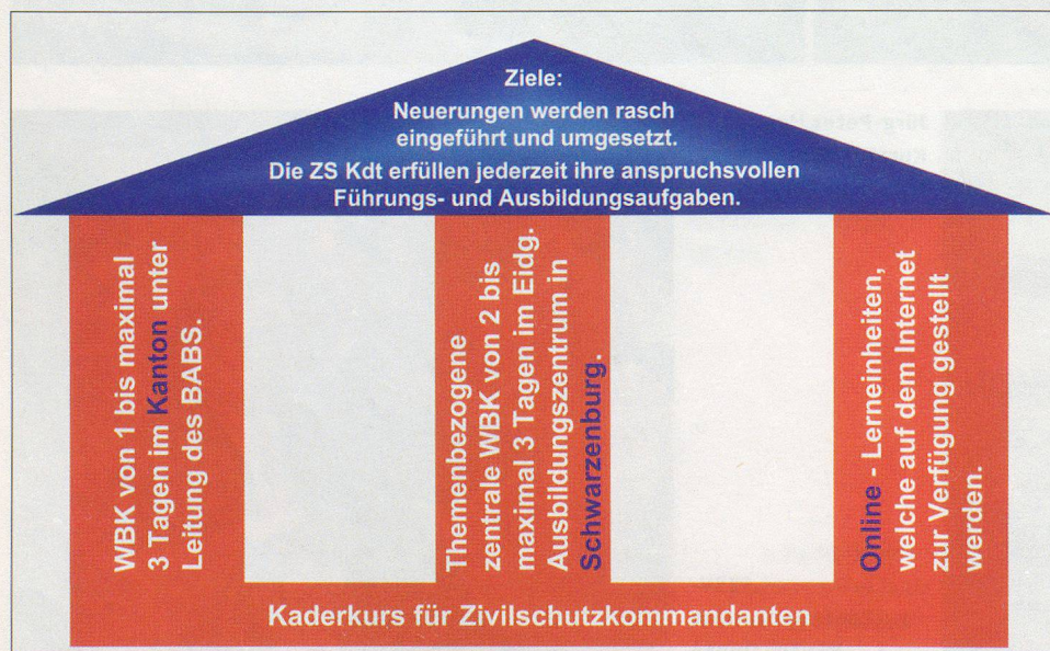
Konzept für die Weiterbildung der Zivilschutzkommandanten.

Wie aus den Kursauswertungen hervorgeht, wurde die Neuerung auch aus Sicht der Zivilschutzkommandanten positiv aufgenommen.