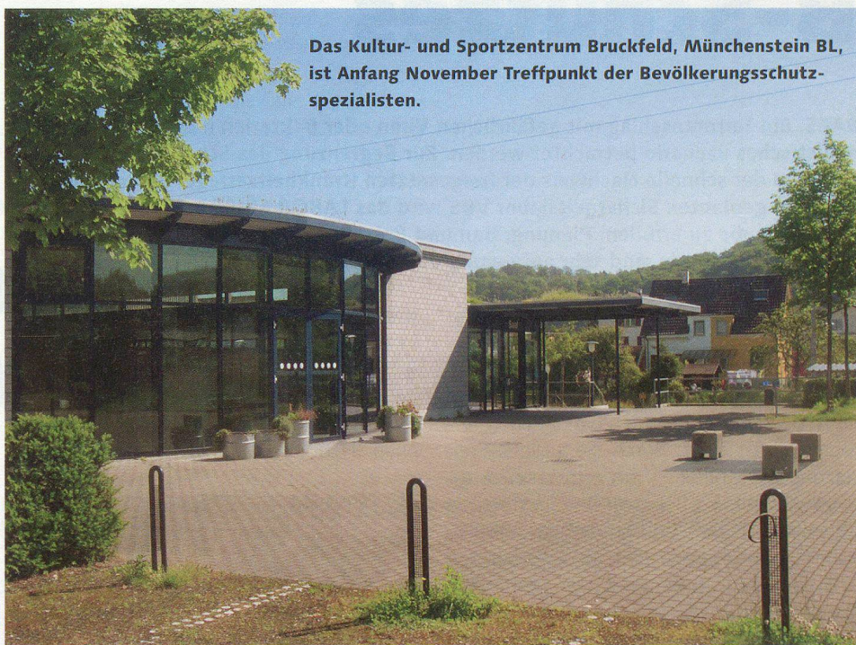
Das Kultur- und Sportzentrum Bruckfeld, Münchenstein BL, ist Anfang November Treffpunkt der Bevölkerungsschutzspezialisten.

Erstklassige Kenner der Materie liefern die Informationen: Nahostexperte Ulrich Tilgner wird im offiziellen Teil der Konferenz zu den «Ursachen des Terrorismus» sprechen.