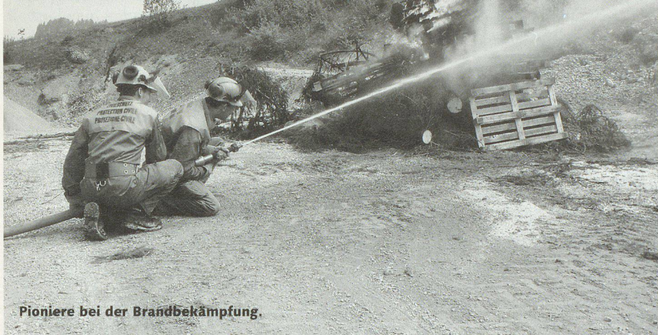
Pioniere bei der Brandbekämpfung.

Die Zivilschutzorganisation (ZSO) Worb-Bigenthal wurde in den Tagen vom 18. bis 20. Mai 2005 durch das Amt für Bevölkerungsschutz, Sport und Militär des Kantons Bern einer ersten Formationsinspektion unterzogen. Dabei mussten die verschiedenen Sachbereiche des Zivilschutzes anspruchsvolle Auflagen erfüllen.