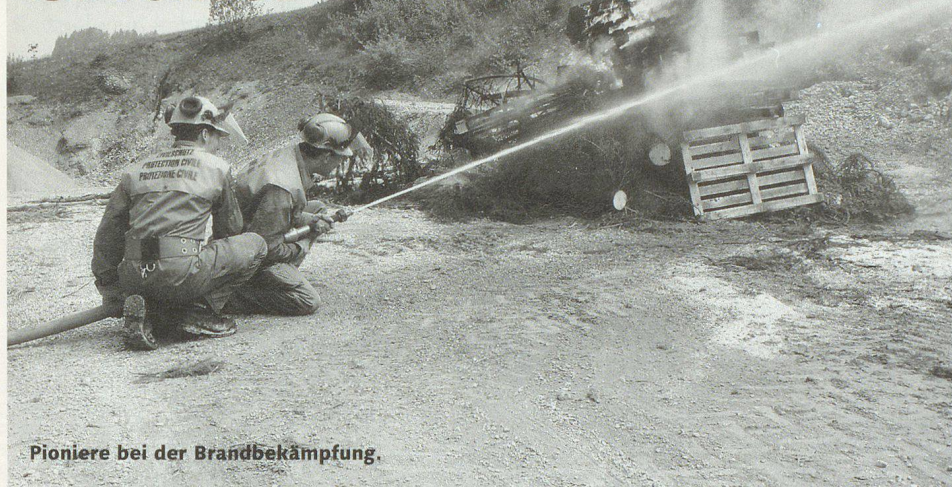
Pioniere bei der Brandbekämpfung.

Die Zivilschutzorganisation (ZSO) Worb-Bigenthal wurde in den Tagen vom 18. bis 20. Mai 2005 durch das Amt für Bevölkerungsschutz, Sport und Militär des Kantons Bern einer ersten Formationsinspektion unterzogen. Dabei mussten die verschiedenen Sachbereiche des Zivilschutzes anspruchsvolle Auflagen erfüllen.