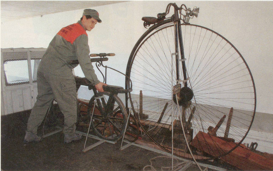
THUN: ZIVILSCHÜTZER ZÜGELTEN EXPONATE DES SCHLOSSMUSEUMS

Die Mittagspausen und die Abendanlässe boten Gelegenheit, mit anderen Teilnehmenden Erfahrungen auszutauschen und sich mit den verschiedenen Kulturen auseinander zu setzen. □