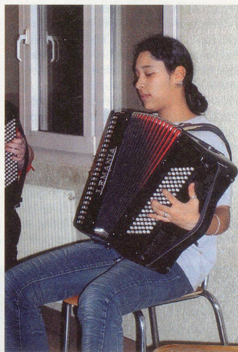
Une accordéoniste au grand cœur.

(Article réalisé avec la documentation fournie par la PCI de la Commune de Charrat; note de la réd.)