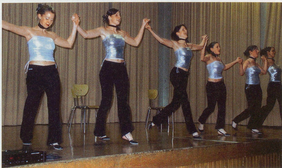
La société de gymnastique l'Helvétia.