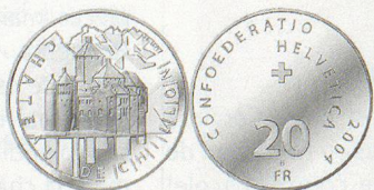
Médaille commémorative frappée par la Confédération.