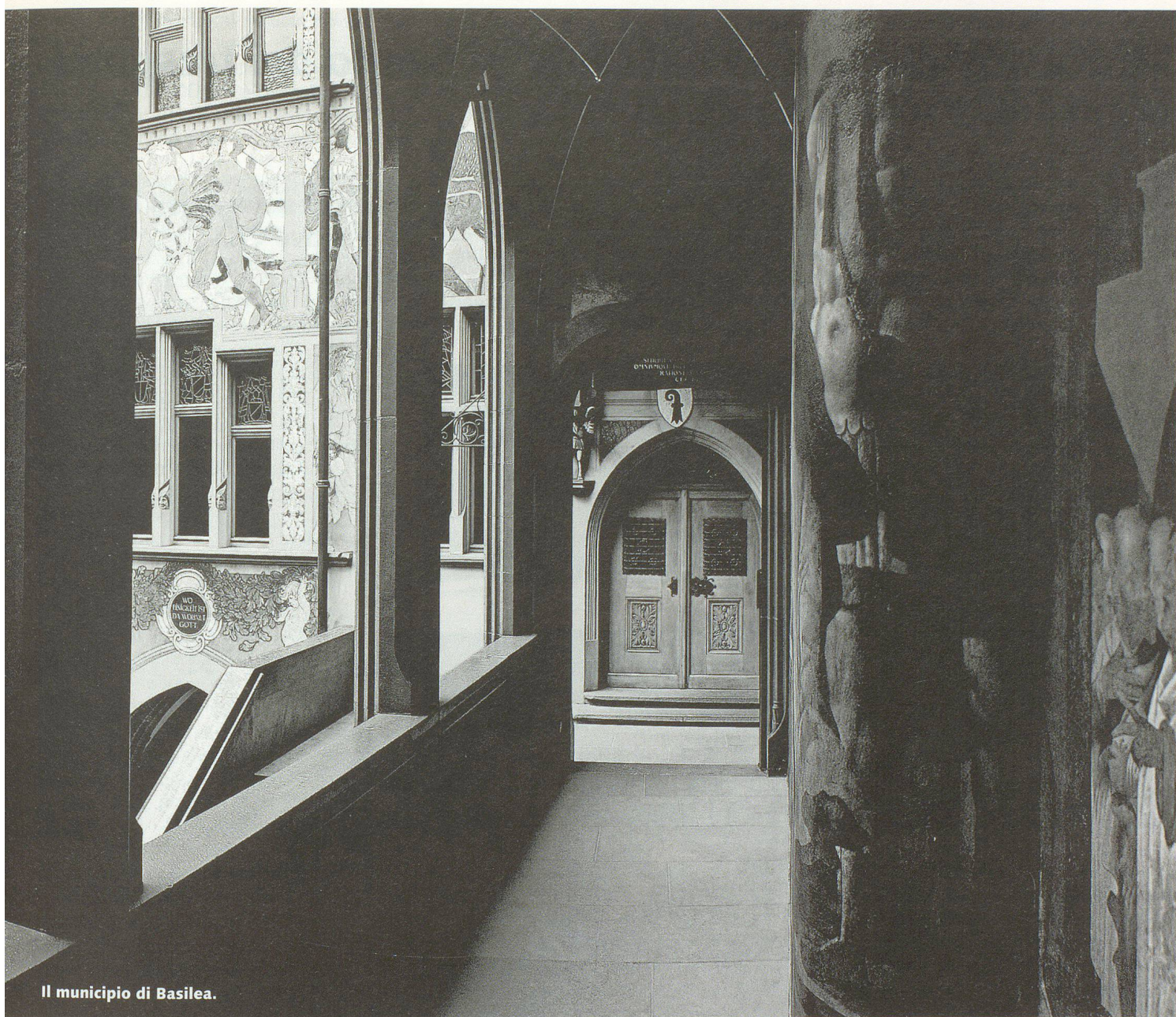
Il municipio di Basilea.