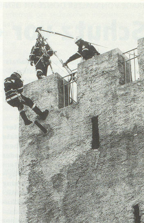
Das Technische Hilfswerk (THW) Lörrach im Einsatz: Demonstration einer Höhenrettung von der Burgruine Rötteln.

Schweizerischer Zivilschutzverband Postfach 8272, 3001 Bern, Telefon 031 381 65 81, Fax 031 382 21 02 E-Mail: szsv-uspc@bluewin.ch